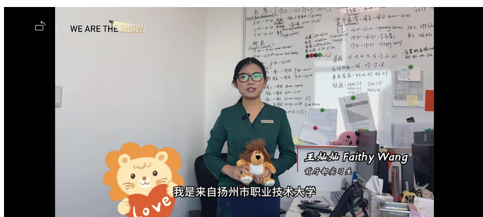
在酒店不同部门实习的学生们